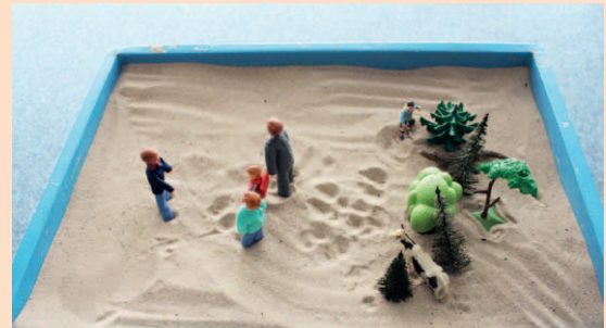
Ein Beispiel aus der Spieltherapie

Die analytische und die tiefenpsychologisch fundierte Psychotherapie bei Kindern und Jugendlichen gehen davon aus, dass sich in der Vergangenheit als Folge unzureichender Verarbeitung von Problemen bei Kindern und Jugendlichen innere Konflikte gebildet haben, die seelische Krankheitsbilder hervorrufen. In beiden Therapieformen versucht der Therapeut mit dem von Sigmund Freud entwickelten Modell und seinen heutigen Weiterentwicklungen, dem Kind oder Jugendlichen zu helfen, sich von diesen Beeinträchtigungen psychischer Erkrankung zu befreien.